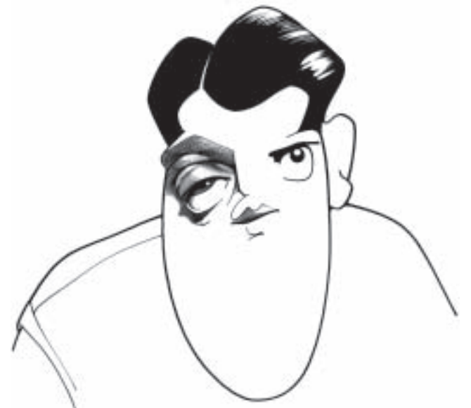
Buñuel por Loredano

Desde los pioneros de fines del siglo XIX (Agostini, Storni, J. Carlos, Max Yantok, etc.) en las páginas de la popular revista Tico-Tico, a los mencionados Ziraldo y Loredano, la producción brasileña en el campo del humor gráfico está en permanente ebullición y viene contagiando a sus pares del resto del