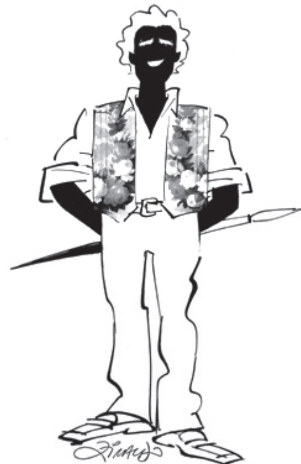
Ziraldo por Ziraldo

continente. Desde las iniciativas particulares o desde el fuerte compromiso asumido por su Ministerio de Cultura, Brasil juega un papel importante