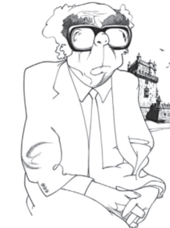
Saramago por Loredano

Donde no existieron opiniones discordantes fue en el rechazo a la consideración de la caricatura como un «arte menor».