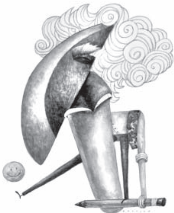
Ziraldo por el dibujante colombiano Turcios