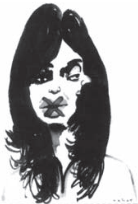
El dibujo de Menchi Sábat que enojó a Cristina Kirchner

pilares de la caricatura argentina, aunque había nacido en Lugo, España, en 1862. La enciclopedia digital Wikipedia resulta avara a la hora de consultar sobre « caricaturistas argentinos ». Solo destaca a dos (y uno es uruguayo). Hermenegildo Menchi Sábat nació en Pocitos en 1933, luego se radicó en Buenos Aires y en 1980 adoptó la doble nacionalidad. Es considerado hoy el dibujante que « ha retratado como nadie la historia política argentina en las últimas cuatro décadas ». Se hizo conocer en los '60 en la revista 'Primera plana', fue pilar en los '70 en el diario 'La Opinión' y desde hace 30 años es la editorial dibujada de 'Clarín'.