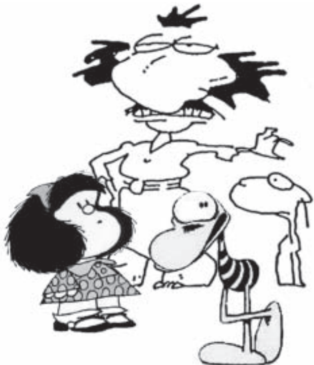
Mafalda, Inodoro Pereyra, el Mendieta y Clemente

Carlos Loiseau nació en 1948 en Salta. Al igual que Quino, publicó sus primeros trabajos en 'Tía Vicenta' y desde hace 40 años lo hace en el diario 'Clarín'. Un personaje sin brazos y con el cuerpo a rayas, es su hijo pródigo. Clemente nació en 1973 y los argentinos lo adoptaron de inmediato, identificándose con su espíritu crítico de la realidad social y su especial gusto por el fútbol y las mujeres. Clemente enfrentó a la dictadura militar y en particular, son memorables las anécdotas del Mundial '78 y su consigna « tiren papelitos ». En 2004, la Legislatura de Buenos Aires declaró a Clemente, Patrimonio Cultural de la ciudad. El pasado 10 de marzo, Caloi fue distinguido como Ciudadano Ilustre, en reconocimiento a toda su trayectoria artística y a su rol de difusor cultural, a través de su multipremiado programa de TV, 'Caloi en su tinta'.