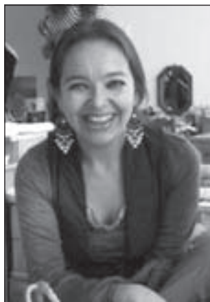
Desde México (Especial para Radar) por María García Esperón (*)