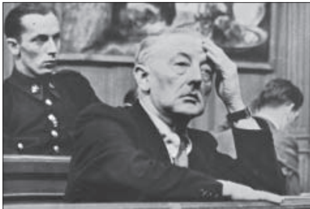
Hans Van Meegeren ante el Tribunal