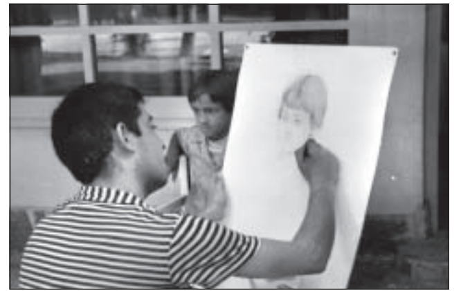
De niño, retratando en 'Las Nubes'