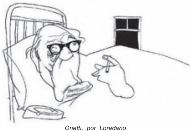
Onetti, por Loredano

relato titulado "El último viernes", que Onetti escribió a lápiz, en un pequeño cuaderno sin renglones, durante el período en que vivió en el barrio San Telmo de Buenos Aires.