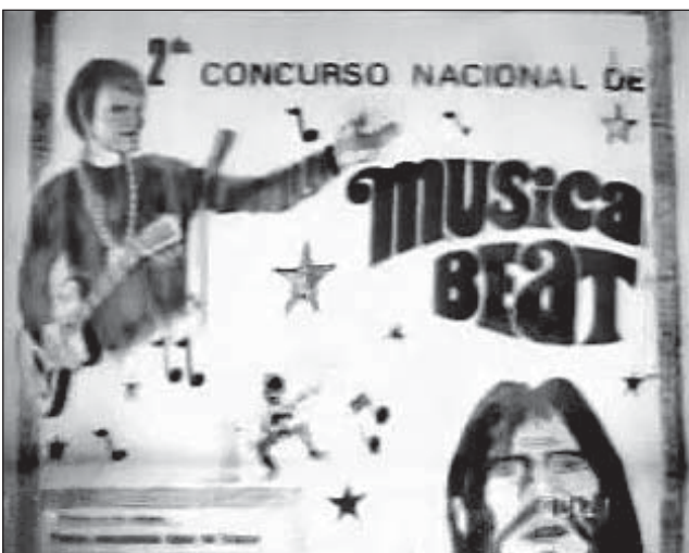
El viejo afiche del festival