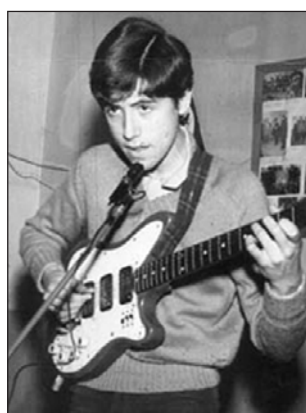
Jaime Roos (1971)

El 'pájaro' voló a Buenos Aires en 1975, donde se habría