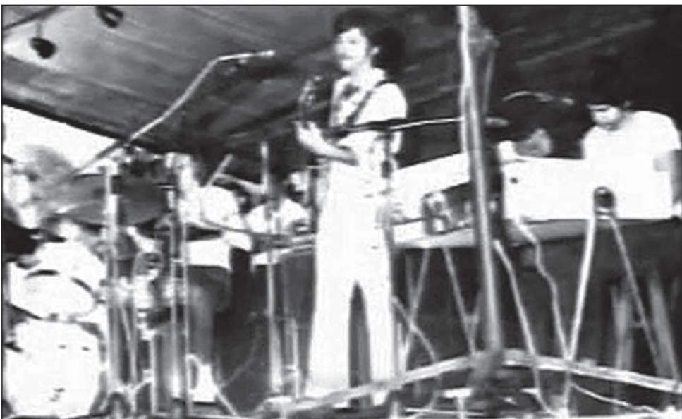
Psiglo sobre el escenario del Parque Harriague (sábado 12 de febrero de 1971)