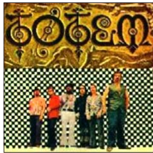
Tótem a partir de ese 12 de febrero

Pero la actuación más trascendente sería la que cumplieron ese 12 de febrero en el Parque Harriague, cerrando el festival.