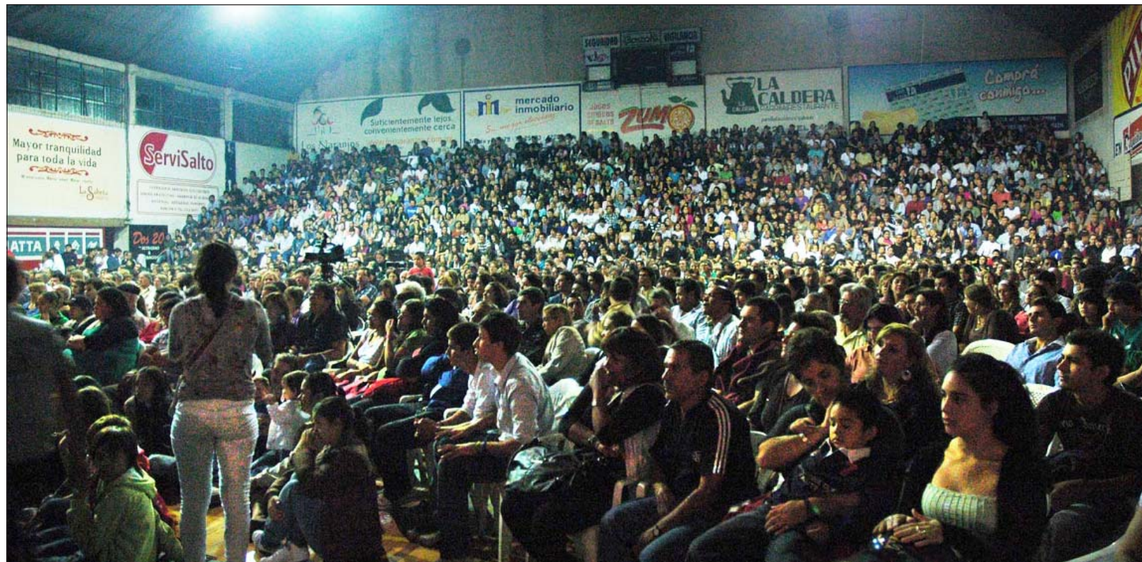
El público desbordó el club Universitario durante la última presentación de la Catalina. Para esta oportunidad, sólo habrán 1.500 localidades disponibles.

"En setiembre vamos nuevamente al encuentro murgue-