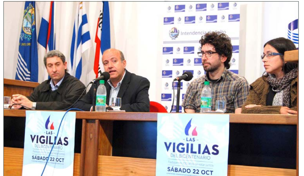
Lanzamiento de "Las Vigilias" en Salto

A esto lo estamos encarando de dos maneras. Por un lado, 'Las Vigilias', que consiste en una fiesta ciudadana que involucra a todas las capitales departamentales, más alguna colonia de uruguayos en el exterior y que pretende celebrar todos juntos y en forma simultánea