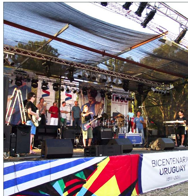
Calurosa prueba de sonido