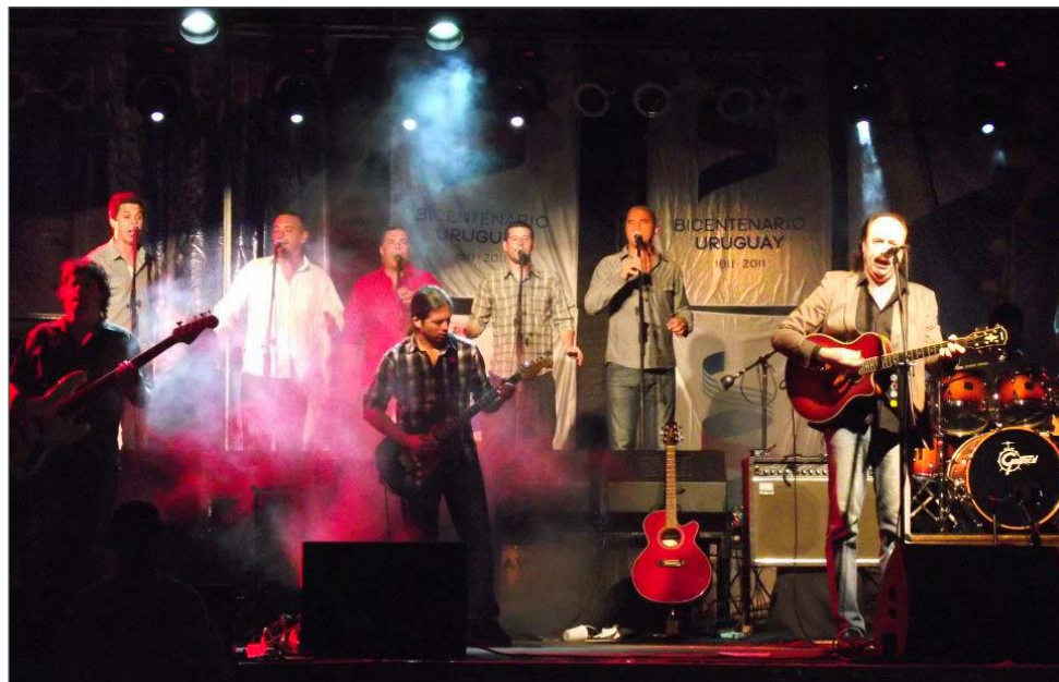
Jaime Roos a pleno