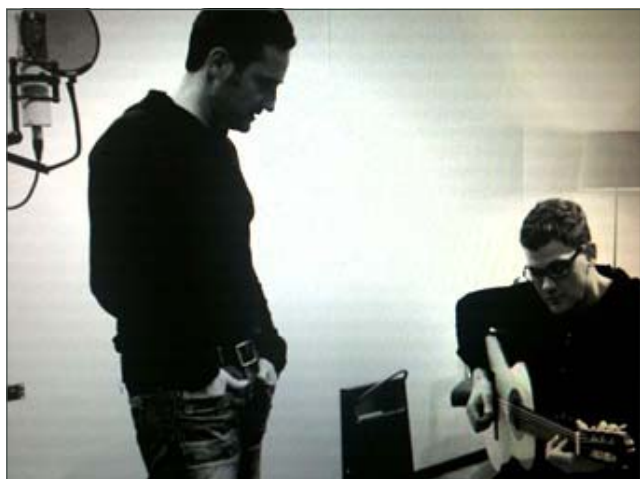
Con Jorge Drexler

Otra novela del exitoso creador de best sellers marketineros en las que encuentra nuevos "caminos de renovación espiritual".