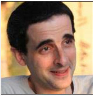
por Alex Borucki

Desde 1999 recibo un sueldo por investigar la historia de los africanos y sus descendientes en el Río de la Plata, y desde 2005 vivo exclusivamente como historiador de estos temas.