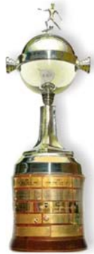
Copa Libertadores de América