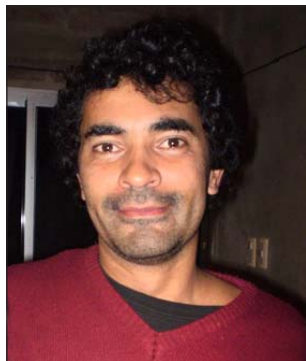
por Alberto 'Negro' Chiriff

Pasó la primera rueda del concurso oficial de Murgas de Salto 2013 organizado por ASAC (Asociación de Artistas Carnavales de Salto) y se empieza a ver por dónde viene la cuestión. Este es un artículo que está dirigido al público de murgas, a ese que no entiende por qué gana una murga y no otra -generalmente "su" murga-. Aclaro que no siempre entiendo por qué gana una murga y no otra ("mi" murga).