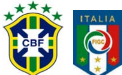
Brasil / Italia Sábado 22 - 16 hs.