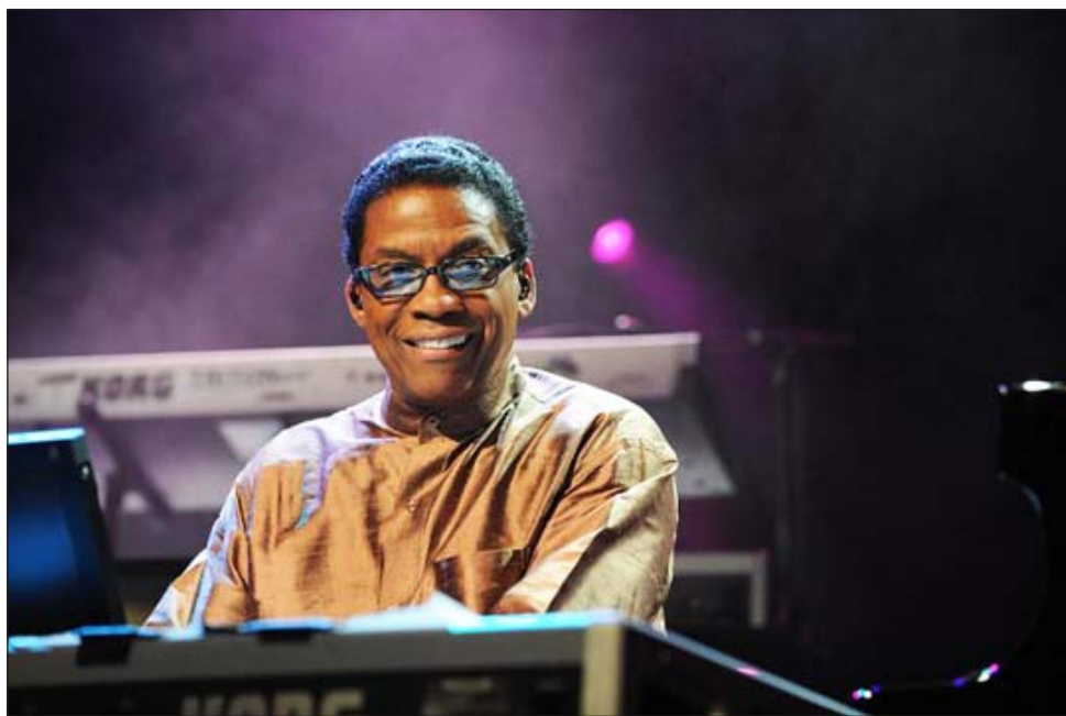
Figura consular del jazz en todo el mundo, Herbie Hancock se decidió a aterrizar en Uruguay y tocará en Montevideo en agosto, en el marco de su gira latinoamericana. El célebre tecladista y compositor nacido en Chicago hace 73 años, acaba de ganar dos nuevos premios Grammy por su disco "The imagine project" y ya suma 16 a lo largo de cinco décadas de trayectoria, aunque tal vez u-

no de sus mayores orgullos sea haber sido considerado por Miles Davis como su "músico favorito".