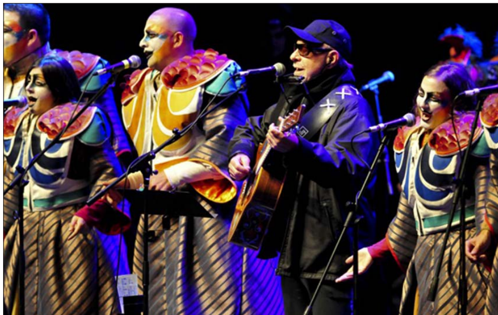
León Gieco y Agarrate Catalina el 12 de abril en el Teatro de Verano

de cucarachas que, a su vez, se burlan del ser humano. Establecer una lógica de cambio en el punto de vista, el ser humano visto desde la óptica de una cucaracha, nos permitió ser más incisivos".