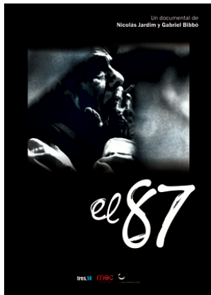
Vuelve "El 87"

rodaje realizado en junio (ver Radar 413), obtuvo un nuevo galardón el pasado domingo al ganar el premio a mejor cortometraje nacional en el V Festival Internacional 'Latinuy', realizado en el Hotel Conrad de Punta del Este.