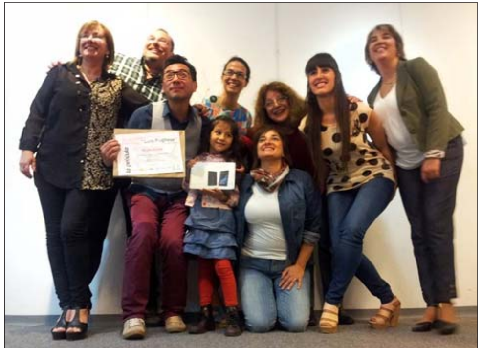
Saladero 19 festejó en San José el primer premio obtenido por el cortometraje "La última vez"

Claro que no fueron las únicas buenas noticias que aparecieron en la semana para la incipiente industria audiovisual local. El viernes pa-