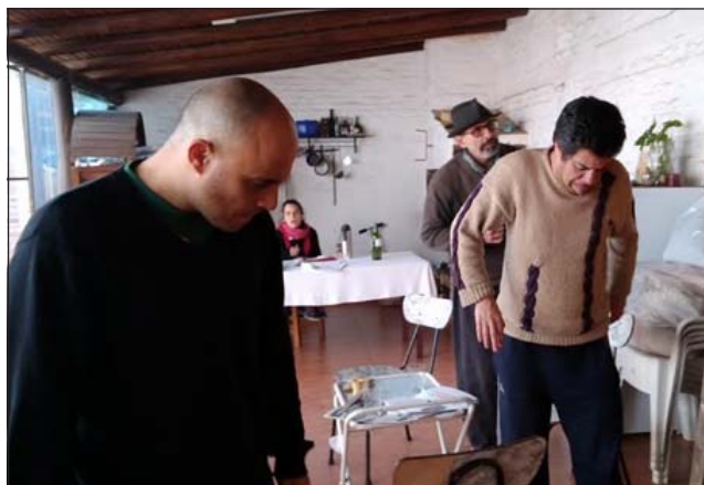
Kalkañal prepara el estreno de "Amapola"

Desde el 28 de abril de 2006, cada edición de RADAR está disponible en Internet y puede bajarse libremente desde el sitio: www.radar.saltonline.net