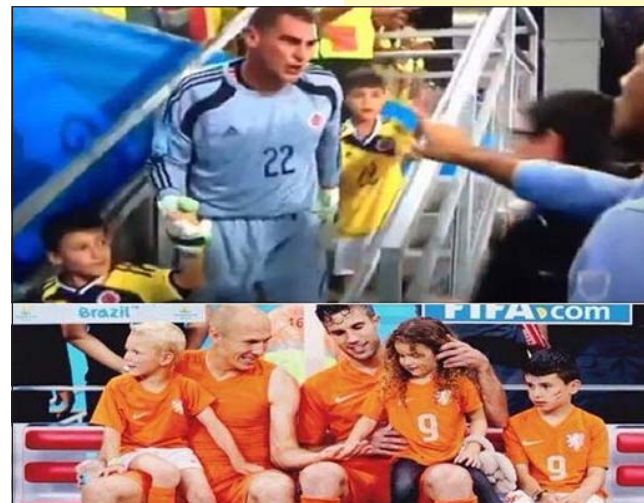
Mondragón no. Robben y Van Persie sí

Una selección brasileña que desde el inicio del torneo dejó en claro que iba a necesitar de varios jueces como el japonés Nishimura para llegar hasta donde pretendía, porque su inexperiencia y su dependencia de unas pocas figuras no le daba crédito suficiente como para saldar aquella "mancha" de 1950. En un país con serios problemas de pobreza, vivienda y educación, donde las protestas contra los gastos del Mundial debieron ser acallados a "palo y fuego", la realización del torneo llevó a desalojar a casi 170.000 personas, para construir obras de infraestructura mundialista