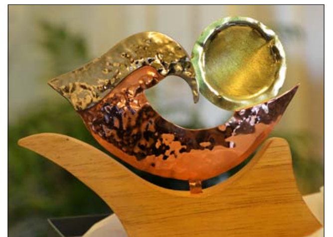
Premio Nacional de Literatura 2014

blemente no han recibido nunca una carta escrita a mano, en papel, con un sobre a su nombre. Y eso a mí me conmueve. Por eso, este libro se fue dando en un terreno que tiene que ver con la construcción del otro a partir de una intimidad emocional que se da entre dos personas, intimidad en el sentido de que cada una le da a la otra un espacio en su pensamiento, en su letra. Lo ampara en su palabra escrita. Le habla de cuestiones tales como lo que ve y siente, dándole importancia a la palabra del otro como creadora de un mundo. Son dos personas que a la distancia pueden crear un universo que no tiene nada que ver con los objetos, el consumo, lo que cada uno tiene en términos de dinero. Es una conversación situada en el nivel de los afectos, de las sensibilidades y de los sueños.