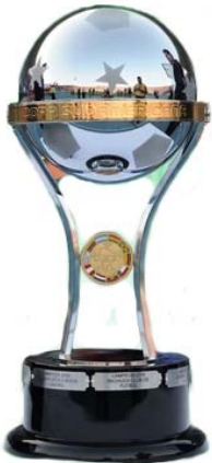
Copa Sudamericana Primera final

Domingo 30 - 18 hs. Valencia / Barcelona