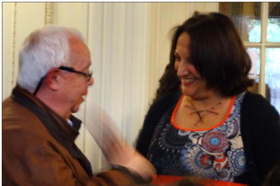
El efusivo saludo del poeta Jorge Arbeleche

Desde el 28 de abril de 2006, cada edición de RADAR está disponible en Internet y puede bajarse libremente desde el sitio: www.radar.saltonline.net