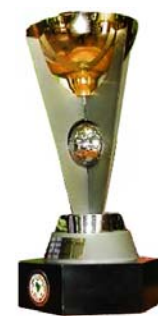
Sudamericano Sub 20 Hexagonal final