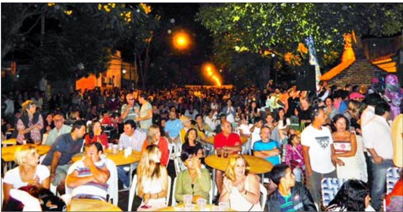
La presencia masiva del público en las previas presentaciones de trajes augura un Parque Harriague colmado para hoy y mañana.

La segunda etapa de esta primera ronda será mañana sábado y Candilejas , otra de las debutantes, tendrá que