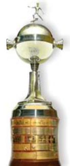
Copa Libertadores Revancha fase preliminar