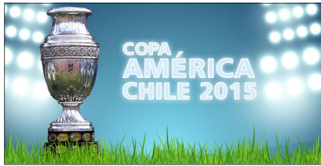
Copa América 2015 Cuartos de final