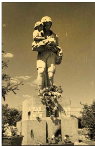
El niño del Arroyo de Oro en Treinta y tres