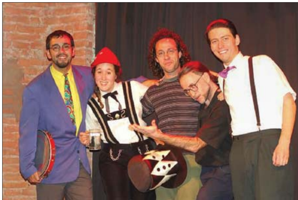
El grupo paranaense Tocomochos trae "¡Afuera!" al Teatro Larrañaga

En este caso, la presentación en el Larrañaga será el domingo 11, tras presentarse en el Teatro Solís de Mon-