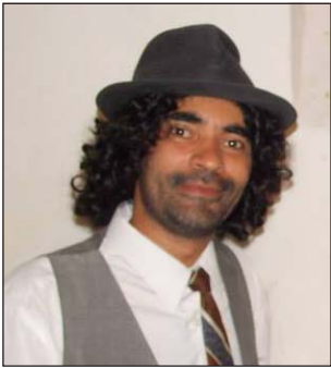
por Alberto 'negro' Chiriff (especial para Radar)

Me voy a referir al coro de la murga; un aspecto muy complejo de analizar debido a la cantidad de influencias musicales, y variaciones históricas, que convergen en lo que hoy escuchamos como coro de murga. Pero hay un fenómeno que se viene dando hace algunos años, no más de una década, en el aspecto coral: un cambio de sonoridad debido a que se está cantando con un micrófono por cada murguista. Esto, que parece un detalle menor, tiene consecuencias en la manera de escuchar (y por consiguiente la relación con el público), en la transmisión del texto, en la expresividad y, lo que quiero subrayar, en el timbre de la murga.