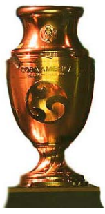
Copa América Centenario