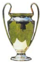
Champions League Final