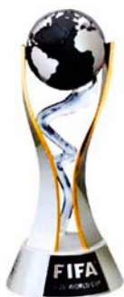
Copa Mundial Sub 20 Corea del Sur 2017