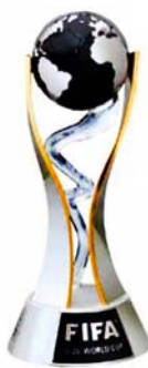
Copa Mundial Sub 20 Cuartos de final