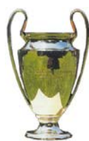
Champions League Final