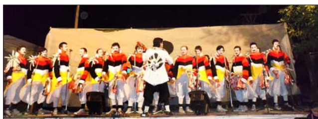
Punto y Coma