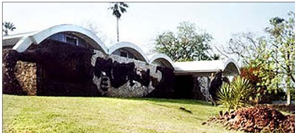
El mural en los vestuarios de Termas del Arapey